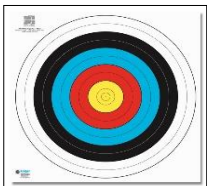
Scheibe Nr. 21 SpO 0.20

Diese Auswahl gilt für die Deutsche Meisterschaft WA in der Halle. Sie kann von den Landesverbänden für ihre Meisterschaften übernommen werden.